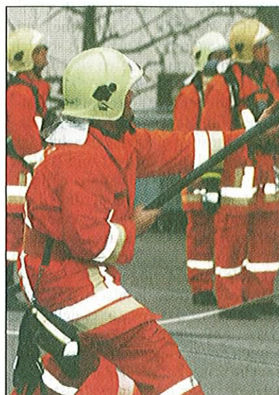
Voller Einsatz beim Erstellen der Leitung für den Schnellangriff.

Die dunklen Rauchschwaden, die aus dem Fenster im zweiten Stock drangen, liessen erahnen, wie stark die Rauchentwicklung in der Wohnung gewesen sein musste. Nachdem die Feuerwehr Hochdorf am vergangenen Freitag kurz nach der Alarmierung durch die Nachbarn (nach 16 Uhr) in die von den Bewohnern verlassene Wohnung eindringen und das Feuer löschen konnte, musste der beissende Rauch nach draussen. Die Bewohner der unteren Wohnung hatten das Haus frühzeitig verlassen können. Die mit 27 eingeteilten angerückte Hochdorfer Feuerwehr konnte den Brand mit Feuerlöschern